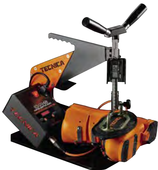
C.A.S. PRO TOOL Nr art.: 450071 00 000