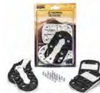
GRIP WALK SOLES MACH1/COCHISE Nr art.: 403A60 00 000