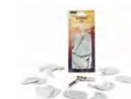
FIT KIT Nr art.: 403A20 00 000