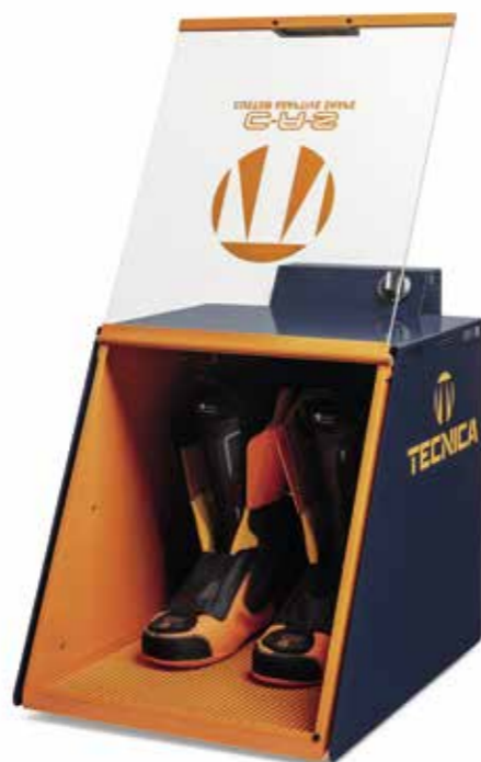
TECNICA C.A.S. OVEN (EU) Nr art.: 403A01 01 001