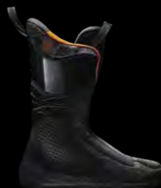
COCHISE 120 DYN GW COCHISE 110 DYN GW