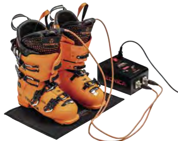
C.A.S. TONGUE THERM.CA.SYS (EU) Nr art.: 450121 00 000