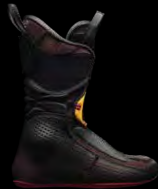
COCHISE 130 DYN GW

COCHISE C.A.S. LINER SĄ LŻEJSZE, MAJĄ ANATOMICZNY KSZTAŁT ZAPEWNIAJĄCY OPTYMALNY KOMFORT I DOSKONAŁE TRZYMANIE PIĘTY. MIKROKOMÓRKOWY MATERIAŁ O PODWÓJNEJ GĘSTOŚCI JEST TRWAŁY I ŁATWY W ADAPTACJI. ABY ZAPEWNIĆ NIEZRÓWNANĄ ZDOLNOŚĆ ADAPTACJI, WKŁADKA C.A.S. MOŻE BYĆ FORMOWANA TERMICZNIE I SZLIFOWANA. NOWA KONSTRUKCJA PRZEDNIEGO PRZECHYŁU ZAPEWNIĄ DOBRĄ WSPINACZKĘ. CHIP RECCO DLA WIĘKSZEGO BEZPIECZEŃSTWA.