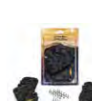
COC.Z.G LOW TECH TOURING SOLES Nr art.: 403A53 00 100