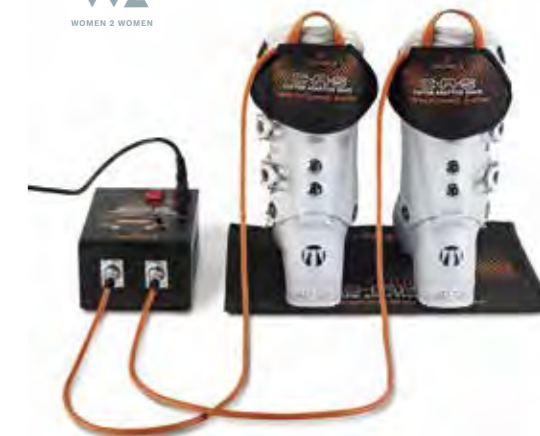
C.A.S. THERMOFORM. SYS. + CUFF (EU) Nr art.: 450065 00 000