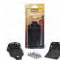
CANTING KIT 1.0° Nr art.: 403A40 00 100