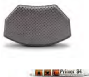
C.A.S. CUFF ADAPT VOLUME REDUCER Nr art.: 403A21 00 000