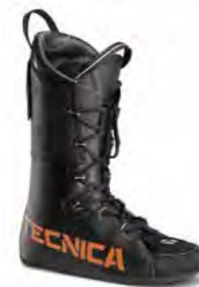
FIREBIRD WC (18) LINER Nr art.: 40110D 00 100