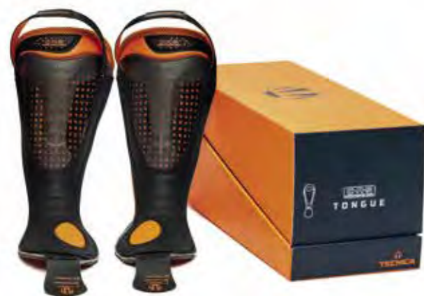
C.A.S. TONGUE Nr art.: 403A22 00 000