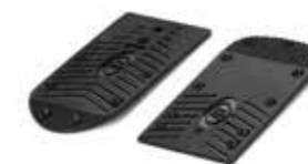
RACE WC (16) 3 MM LIFTER SOLE Nr art.: 40396A 00 002