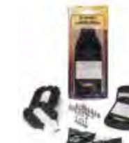
COC.Z.G LOW TECH ALPINE SOLES Nr art.: 403A52 00 000